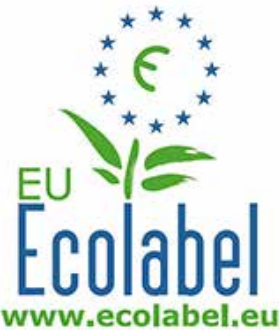
Euroopan unionin ympäristömerkki

Euroopan unionin myöntämät erilaiset ympäristösertifioinnit ovat osin myös kosmetiikkavalmistajien käytettävissä. Euroopan unionin ympäristömerkki kategorisoi poispestävät kosmeettiset valmisteet, esimerkiksi kasvojenpesuaineet ja hammastahnat ympäristömerkin piiriin (2014/893/EU). Tunnetuin sertifiointikäytäntö unionin alueella on Euroopan unionin luomusertifiointi. Luomusertifiointi keskittyy pääasiassa maatalouteen, mutta on sovellettavissa hyvin kosmetiikan alalle raaka-aineiden osalta. Merkkiä ei kuitenkaan voida käyttää markkinoinnillisissa tarkoituksissa. Luomusertifioitun raaka-aineen käyttö kuitenkin mahdollistaa ainesosien merkitsemisen luomulaatuiseksi.